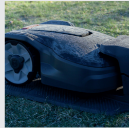
Frost Guard schützt ihren Rasen vor Schäden