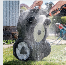
Mit dem Wasserschlauch abwaschbar